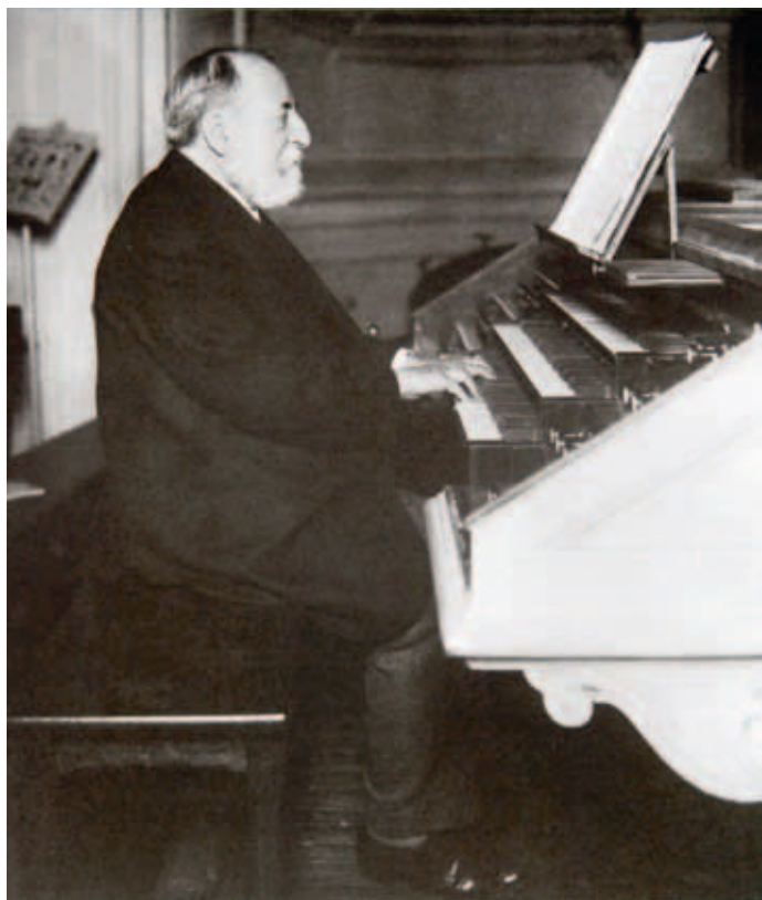
Saint-Saëns bespeelt het orgel in de Salle Gaveau, 6 november 1913.

weer op. Vanaf 1896 maakte hij weer orgeltournees, onder meer gaf hij een groot aantal concerten in Nederland. Tussen 1894 en 1898 schreef Saint-Saëns een nieuwe reeks orgelwerken: de Trois Préludes et Fugues opus 99 (1894), de Fantaisie opus 101 (1895), de Marche religieuse opus 107 (1897?) en de Trois Préludes et fugues opus 109 (1898). De Trois Préludes et Fugues opus 99 zijn de eerste orgelwerken na bijna dertig jaar, ze werden respectievelijk opgedragen aan Widor, Guilmant en Gigout en zouden naar het oordeel van Vierne verplichte kost moeten zijn voor elke serieuze organist. De eerste twee stukken zijn gracieus en smaakvol en behoren tot zijn beste composities voor het instrument, het derde stuk daarentegen is in muzikaal opzicht wat minder aantrekkelijk. De Fantaisie opus 101 is een van de meest romantische werken van Saint-Saëns. De pompeuze Marche religieuse voerde Saint-Saëns uit in een privéconcert voor de Spaanse koningin Maria Christina in de San Francisco-kerk in Madrid; ook speelde hij het