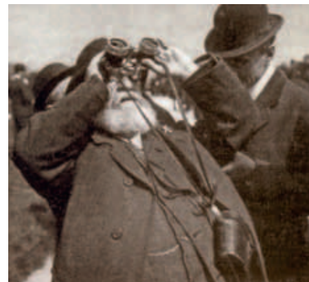
Een vooruitziende blik ... Saint-Saëns observeert in Saint-Germain-en-Laye de zonsverduistering op 17 april 1912.

In 1879 publiceerde Saint-Saëns in het tijdschrift Nouvelle Revue een artikel waarin hij vooruitblijkt: "Met de tonaliteit is het thans langzamerhand gedaan. Er zal een nieuwe ontwikkeling komen waarin het ritme dat tot nog toe een bescheiden rol speelde een bijzondere plaats zal krijgen. Uit de nieuwe combinatie van deze twee elementen zal een nieuwe muziek ontstaan." Schönberg publiceerde zijn Drei Klavierstücke in 1909, Scriabin overleed in 1915, Debussy in 1918. Saint-Saëns, die beide laatsten overleefde, had het in 1879 goed gezien, hij heeft de nieuwe muziek nog meegemaakt maar was zelf intussen een muzikaal anachronisme geworden.