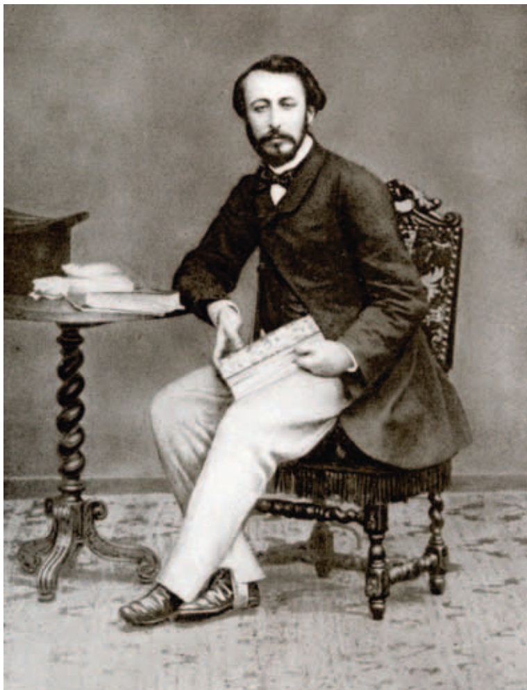
Saint-Saëns op jongere leeftijd.