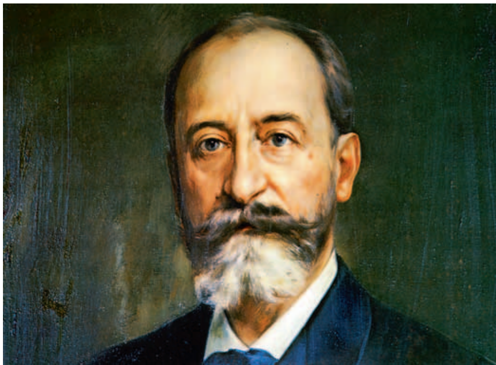
Anoniem portret van Saint-Saëns dat zich in het conservatorium van Napels bevindt.

Stelt u zich voor, een pianist van 10 jaar die behalve enkele werken van Bach en Händel het derde pianoconcert van Beethoven en Mozarts pianoconcert KV 450 ten gehore brengt, alles uit het hoofd; en voor de toegift kan het publiek een vrije keuze maken uit de 32 pianosonates van Beethoven, die hij eveneens uit het hoofd tot zijn beschikking heeft. Dit was wat het wonderkind Camille Saint-Saëns op 6 mei 1846 presteerde. En alsof dat nog niet genoeg is, de 'jongeman' had toen reeds een aantal composities op zijn naam staan, las Latijn en Grieks en vertoonde een uitzonderlijke belangstelling voor de meest uiteenlopende zaken.