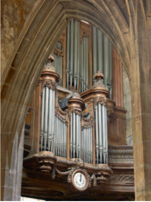
Het Cliquot-orgel in de Eglise Saint-Merri, Parijs.