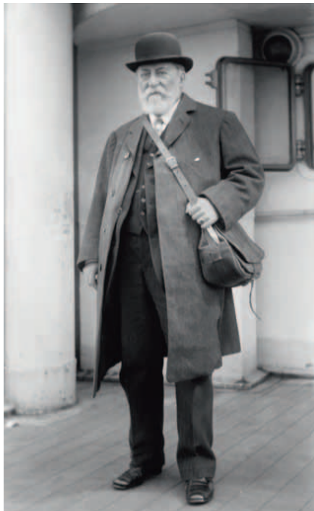
Saint-Saëns op tournee.