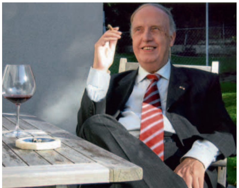
Op zijn verjaardag, 20 september 2007, in zijn geliefde Oostenrijk.