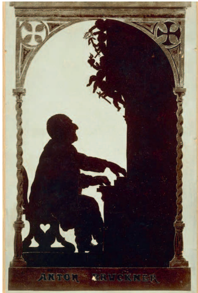
Bruckner aan het orgel, silhouet van Otto Böhler, ca. 1890.

“Bruckner zelf heeft zich daarover nooit uitgelaten, maar als je kijkt naar de bloksgewijze opbouw van zijn symfonieën, kun je daar zeker orgelmatige elementen in herkennen. Na een bepaalde passage krijg je een Generalpause , dan volgt er een lyrisch thema dat ook weer afgesloten wordt met een korte pauze, en vervolgens wordt er een derde thema uitgewerkt. Die opbouw verraadt Bruckners ‘orga-