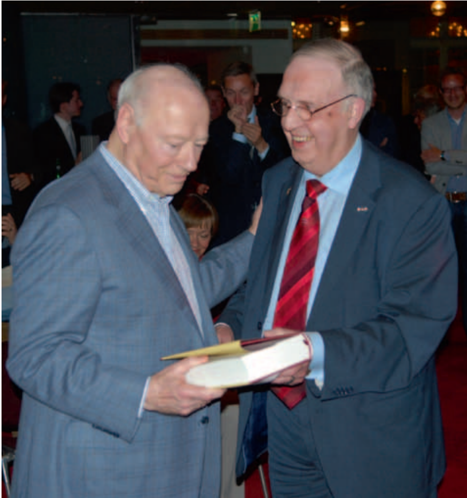
Overhandiging van het eerste exemplaar van de Bruckner-biografie aan Bernard Haitink, op 16 mei jl. in de foyer van het Concertgebouw te Amsterdam.